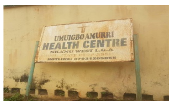
Billboard umuigbo Amurri