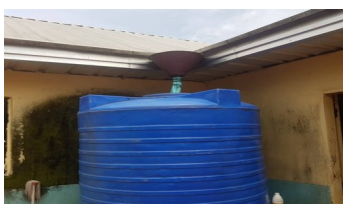
De onhygienische watertank

In november 2022 zijn we gestart met de realisatie van het project dat de Alaogidi basisschool in Imo State en het Umuigbo Amurri gezondheids-zwangerschapscentrum in Enugu state voorziet van schoon drinkwater en goede sanitaire faciliteiten. Hieronder een paar foto's van de toestand op het Umuigbo Amurri centrum voor aanvang van het project.