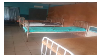
De Umuigbo Amurri ziekenzaal