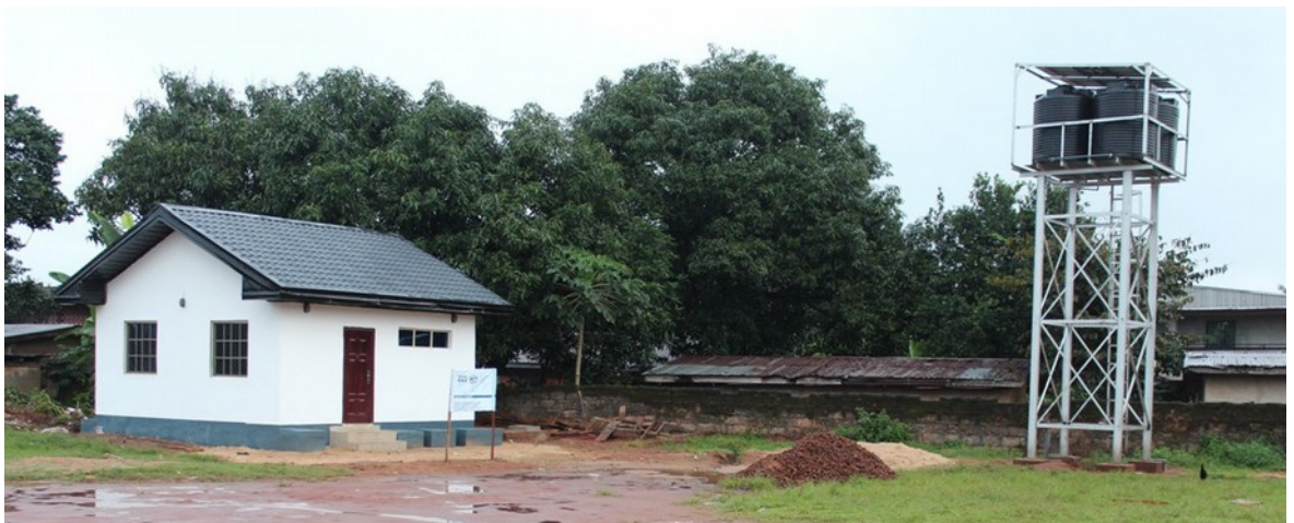
Het eerste voltooide project in Ukpo, toiletgebouw en watertoren met pomp op zonne-energie

Het verbeteren van de levensverwachting en levensstandaard van in het bijzonder vrouwen en kinderen op het platteland van Afrika, door de realisatie van toegang tot schoon drinkwater, sanitaire voorzieningen, voedselzekerheid, zelfredzaamheid en duurzame ontwikkeling.