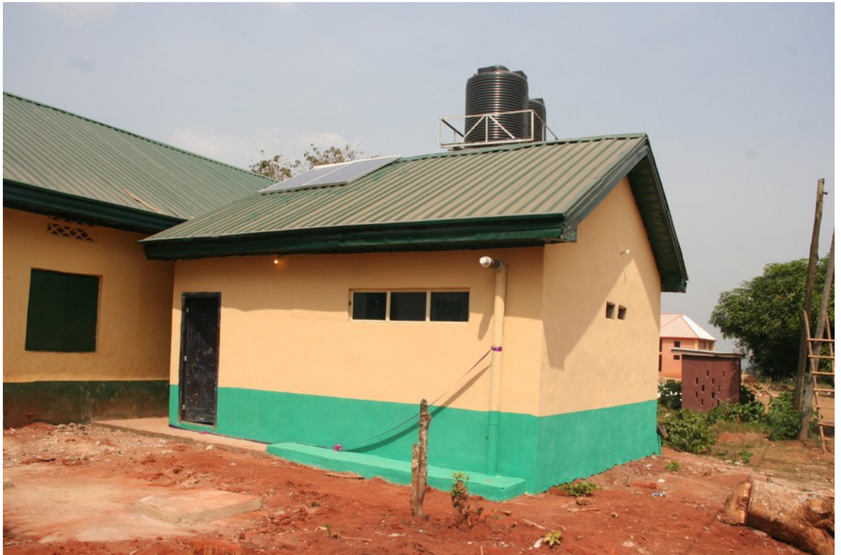
Het 2de project in Nigeria, ook bij een basisschool in Ukpo