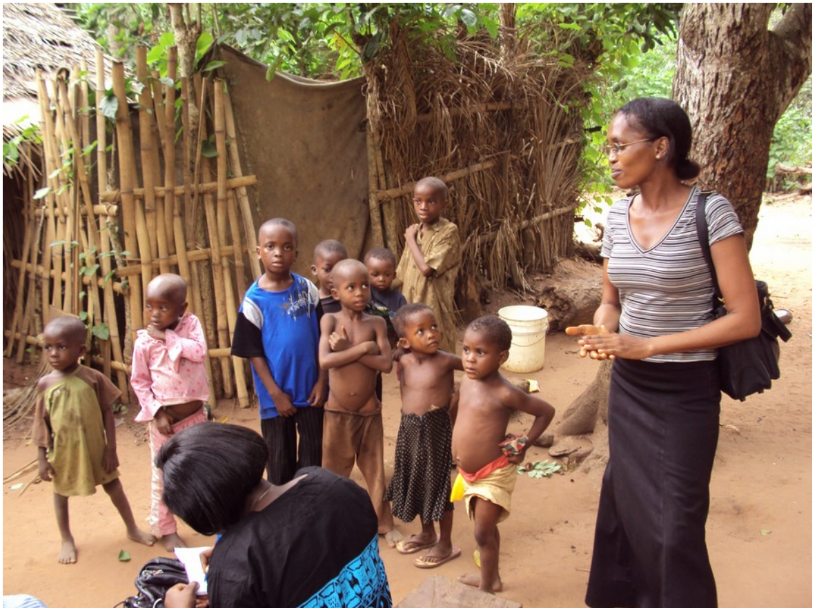
RWF medewerkers bezoeken Ukpo, Anambra State, Nigeria

In 2014 werden de contacten met partnerorganisaties en stichtingen en donateurs verder opgebouwd en uitgebreid, voor 2015 is een verdere verbreding en verdieping van onze contacten voorzien.