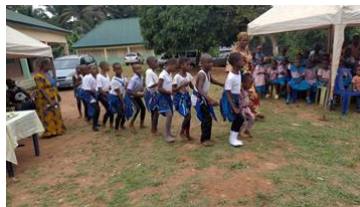
De kinderen van de Alaogidi basisschool zijn heel blij!