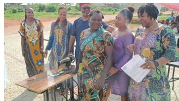
De prijswinnaar van de naaiopleiding krijgt een naaimachine!