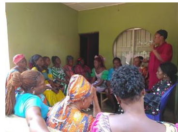
Voorlichting aan een groepje vrouwen