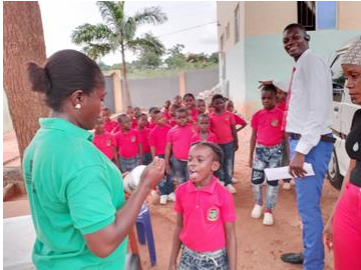
Leerlingen van de RWF basisschool ontvangen hun vitamines

Consultatiebureau: Begin augustus 2023 heeft het consultatiebureau in het MPC haar deuren geopend voor moeders met kinderen. Er kwamen onmiddellijk al een aantal moeders naar toe om de gezondheid en de groei van hun kinderen te laten controleren. Er zijn 2 verpleegsters werkzaam op het consultatiebureau. De komende periode zal worden onderzocht aan welke praktische dienstverlening er de meeste behoefte bestaat, zodat de activiteiten hierop zo goed mogelijk kunnen worden afgestemd.