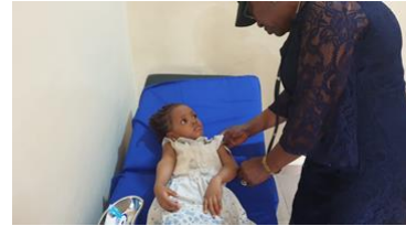
Ook de gezonde groei van babies wordt gemeten.