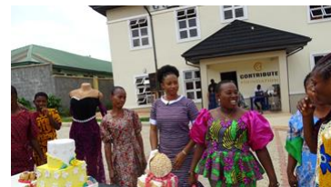
Alle prijswinnaars van de naaiopleiding in hun eigen ontwerpen