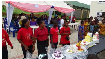
De prijswinnaars van de bakopleiding in april 2023