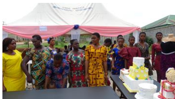
De producten van de naai en de bakopleiding worden vol trots getoond