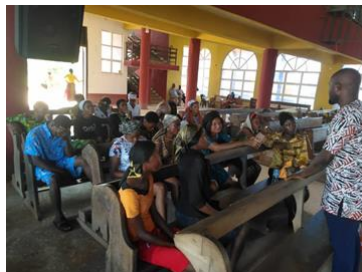
Voorlichting aan jong volwassenen