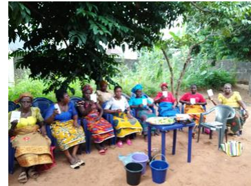
DSLVA bijeenkomst in Amawbia