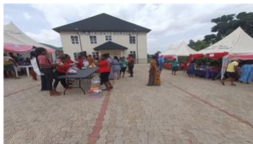
Overzichtsfoto van de diploma uitreiking in april 2023 bij het MFC in Ukpo