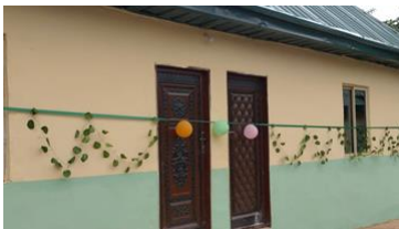
Het nieuwe toiletgebouw tijdens de feestelijke opening

Door middel van deze beide projecten zijn circa 390 basisschool leerlingen uit Alaogidi en ca. 80 dagelijkse patiënten van het gezondheidscentrum in Umuigbo Amurri toegevoegd aan de (lange) lijst van vrouwen en kinderen die inmiddels profiteren van onze drinkwater en sanitatie projecten op het platteland van Zuidoost Nigeria.