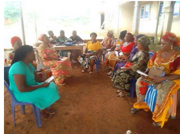
DSLVA bijeenkomst in Ukwulu