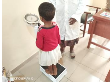
Op de weegschaal bij het consultatiebureau!