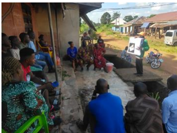
Voorlichting aan een groepje mannen

De activiteiten op het gebied van gezinsplanning zijn in de afgelopen periode zo veel mogelijk voortgezet. In september is het nieuwe academische jaar van start gegaan op de universiteit van Awka en kunnen de bekende "peer group" sessies met studenten ook weer plaatsvinden. De Nnamdi Azikiwe Universiteit is met ruim 33.000 studenten een van de grootste universiteiten van Nigeria (nr. 12 op de ranglijst).