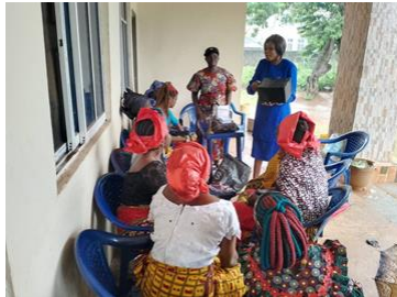
DSLVA voorlichting in Nawgu