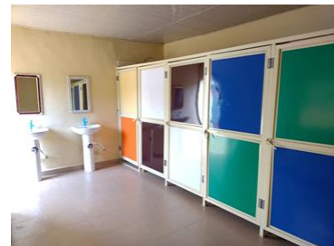
Overzichtsfoto van het meisje toilet