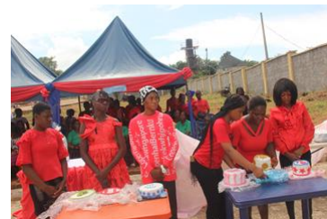
De taarten worden alvast klaargezet